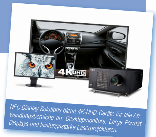
NEC Display Solutions bietet 4K-UHD-Geräte für alle Anwendungsbereiche an: Desktopmonitore, Large Format Displays und leistungsstarke Laserprojektoren.

Bei zahlreichen spektakulären Veranstaltungen werden großformatige Bildschirme oder Projektoren eingesetzt, um wichtige Informationen zu vermitteln oder mit farbigen Bildern, Logos und Grafiken eine bestimmte Atmosphäre und Stimmung zu schaffen.